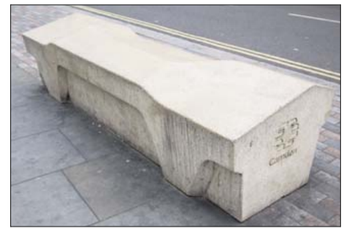
I London-bydelen Camden står "Camden bench", som af mange er blevet kaldt »det ultimative anti-objekt.«

og ændre vores adfærd på en måde, som vi ikke tager anstød af.