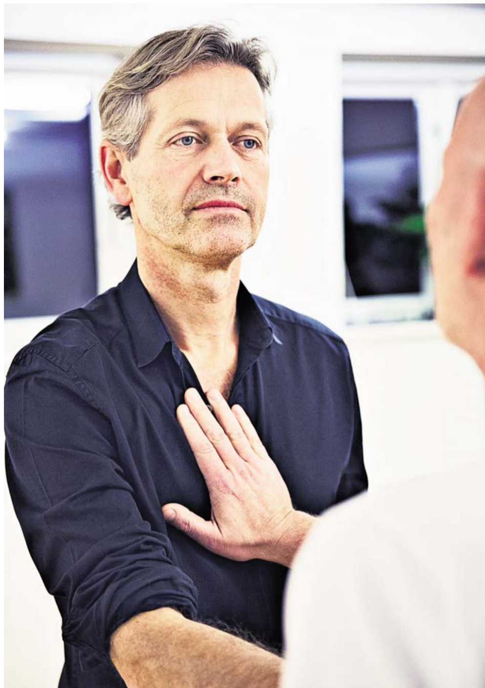
Mændene i Mandegruppe 18 KBH er rutinerede mandegruppegængere. Gennem tre en halv måned er de mødtes hver onsdag aften fra kl. 19.00 til kl. 22.30.