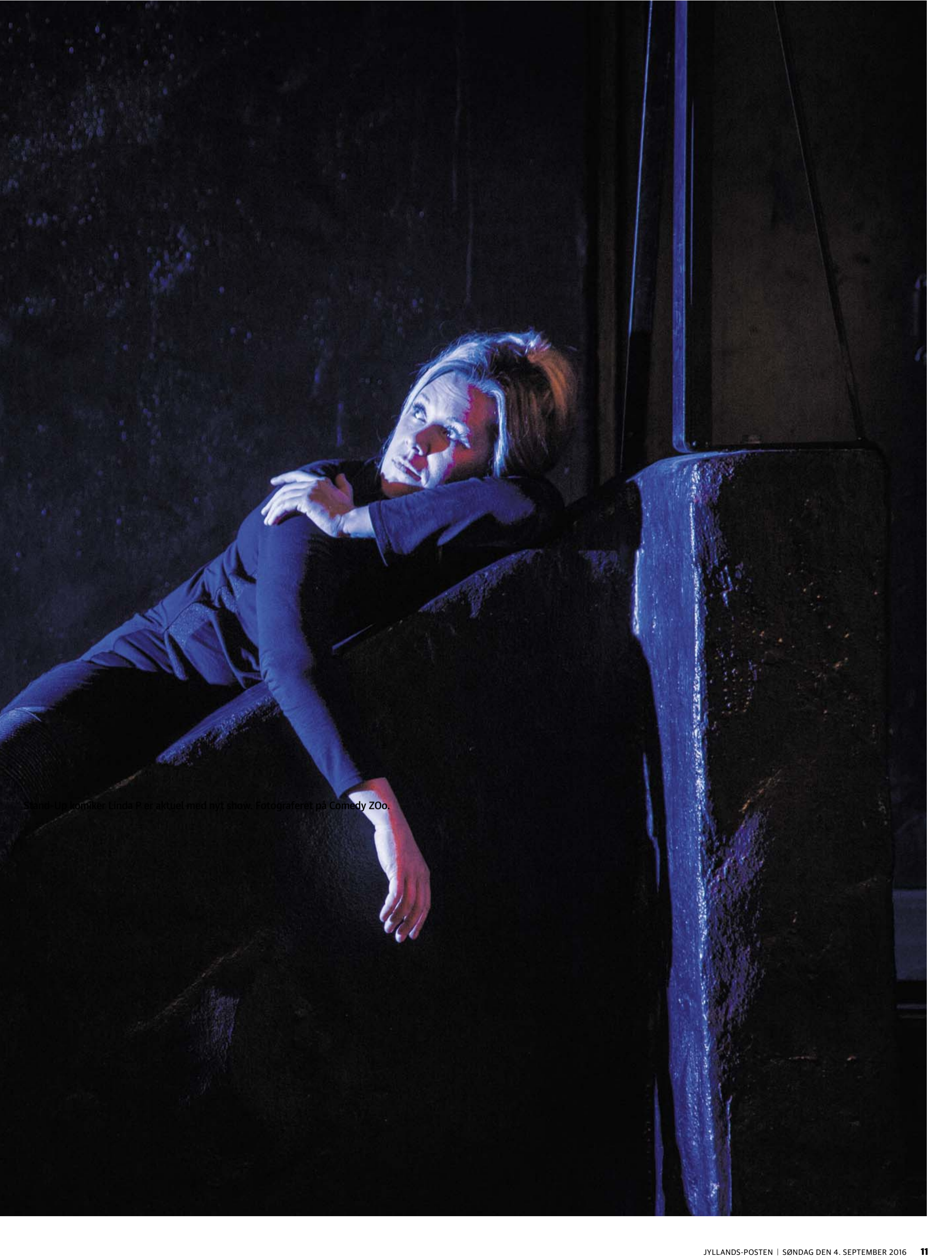
Stand-up komiker Linda P er aktuell med nyt show. Fotograferet på Comedy Zoo.