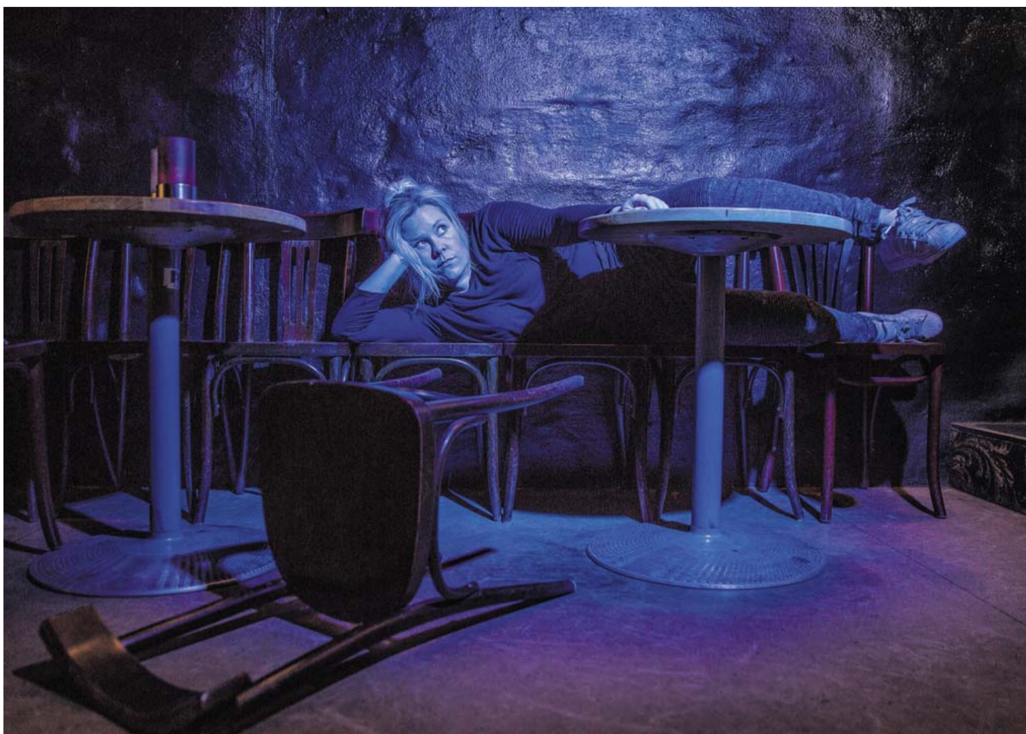
Da Linda P i begyndelsen af 2014 turnerede rundt med sit tredje onemanshow, "Linda P's Hovedpine", var hun stadig syg af stress: »Det var ren overlevelse. Jeg var ikke klar til at optræde, og mest af alt handlede det for mig om ikke at kaste op på scenen af nervøsitet. Det var lidt absurd at stå og tale om, at jeg havde det dårligt, mens jeg virkelig havde det dårligt.«